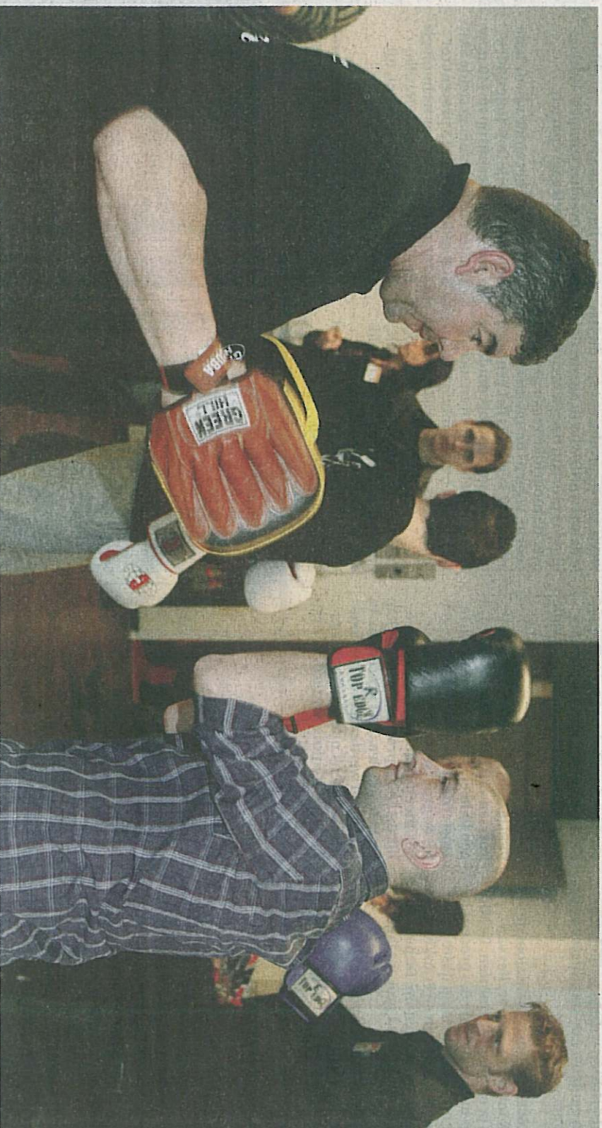
Telefonische deurwaarders volgen een boksworkshop tijdens de zogenaemde Incasso Games. Een van de opdrachten tijdens dit kampioenschap is het 'binnen praten' via de telefoon van zoveel mogelijk geld. De winnaar mag zich nationale incassokampioen noemen.